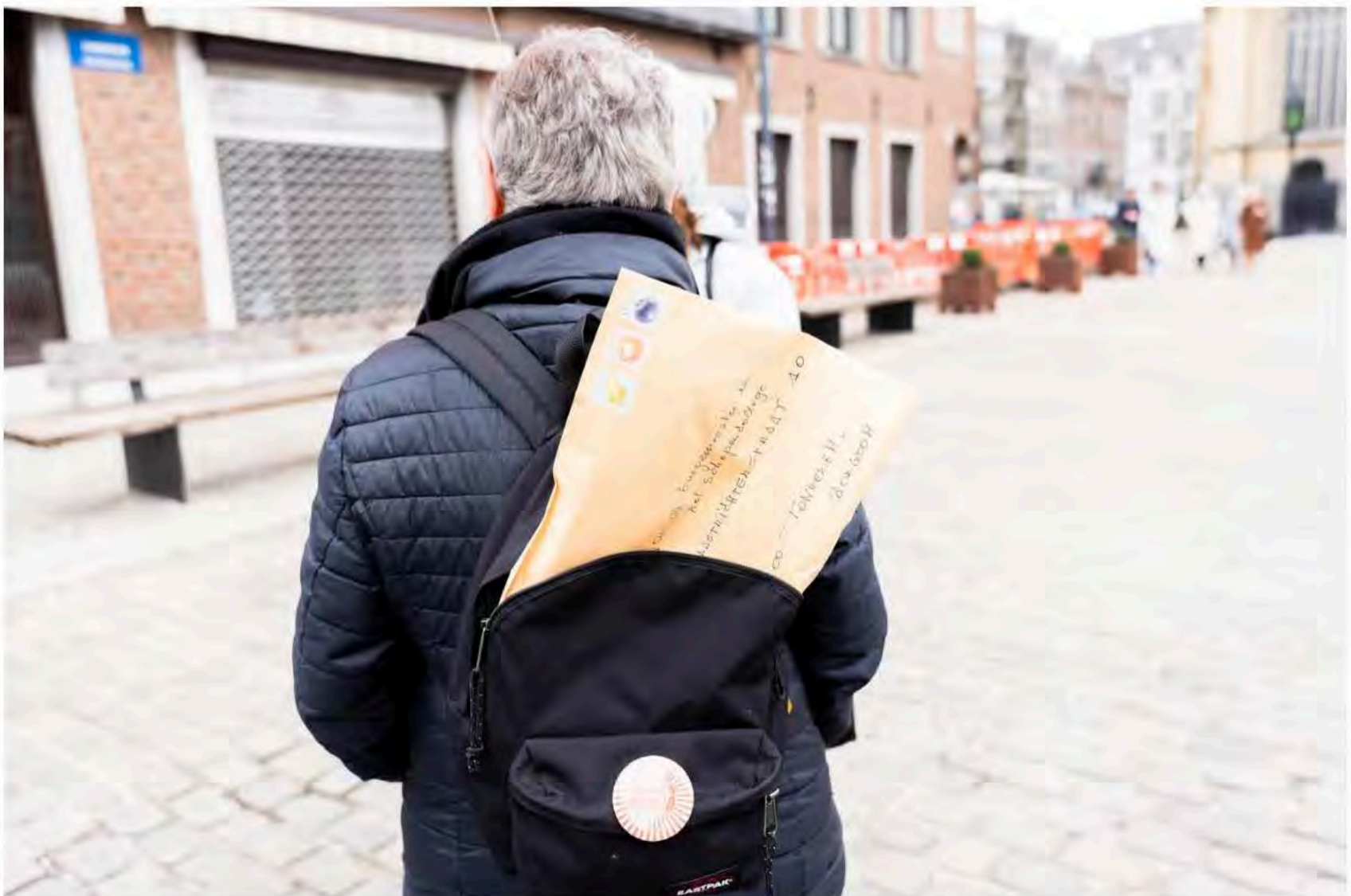
De petitie werd afgegeven op het stadhuis in Tongeren.