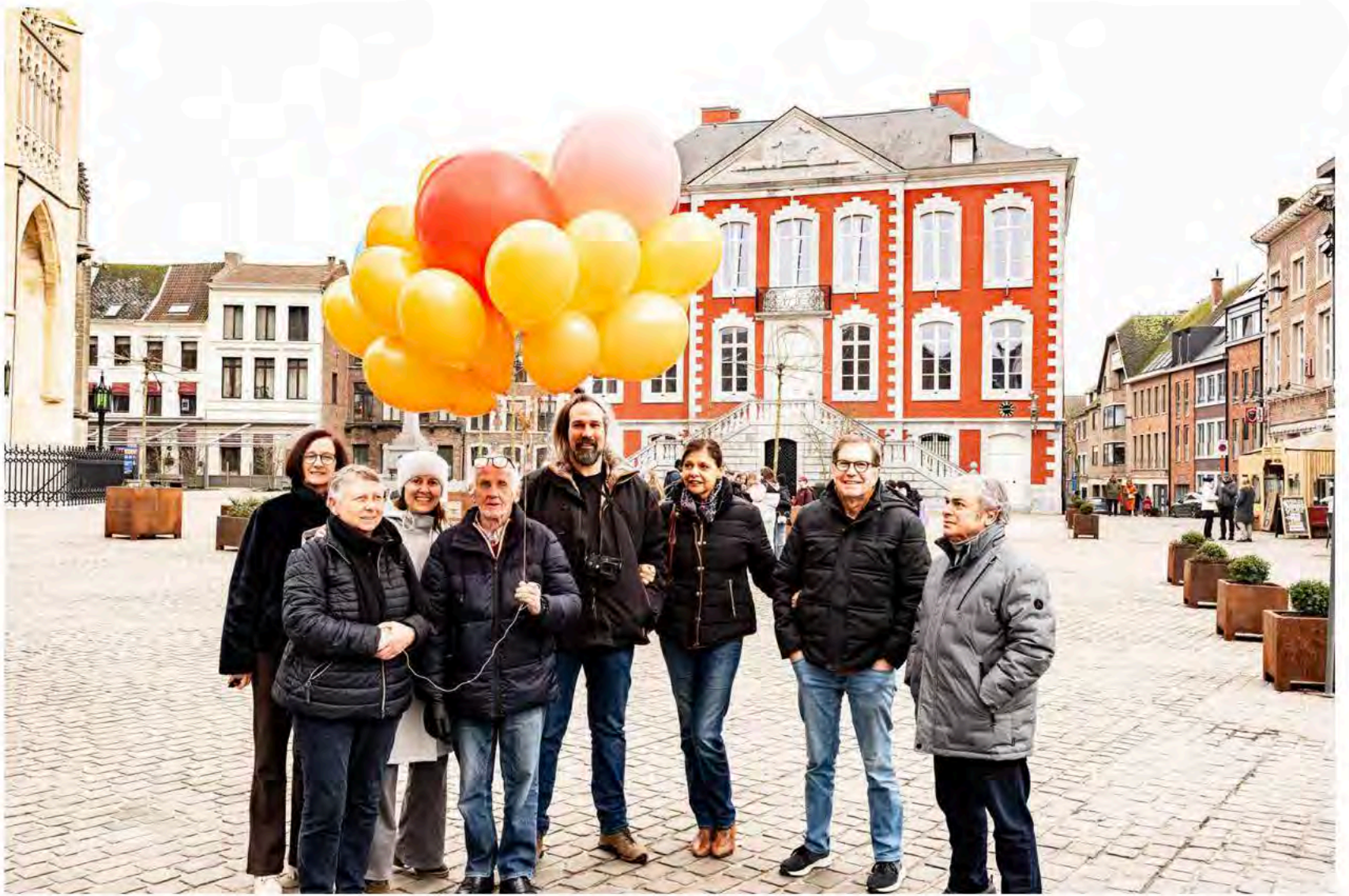
Burgers Eerst steunt het actiecomité uit Vreeren en Sluizen en het actiecomité uit Riemst. Ze verzamelden 531 handtekeningen.