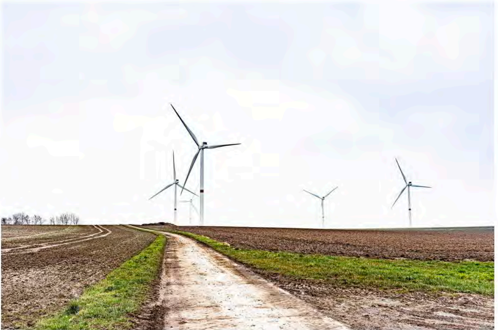
In de buurt staan al windmolens, met name in Juprelle.

Het buurtcomité van indertijd is opnieuw in actie geschoten. “In 2017 hebben we het kunnen tegenhouden. Nu komen ze af met nog hogere turbines. Ze beloven ons dat er geen hinder zal zijn, maar we hebben nu al last van slagschaduw van de turbines in Juprelle die op anderhalve km staan en nu komen er op 480 meter van het dichtstbijgelegen huis”, klagten Annie en Danny uit Vreren.