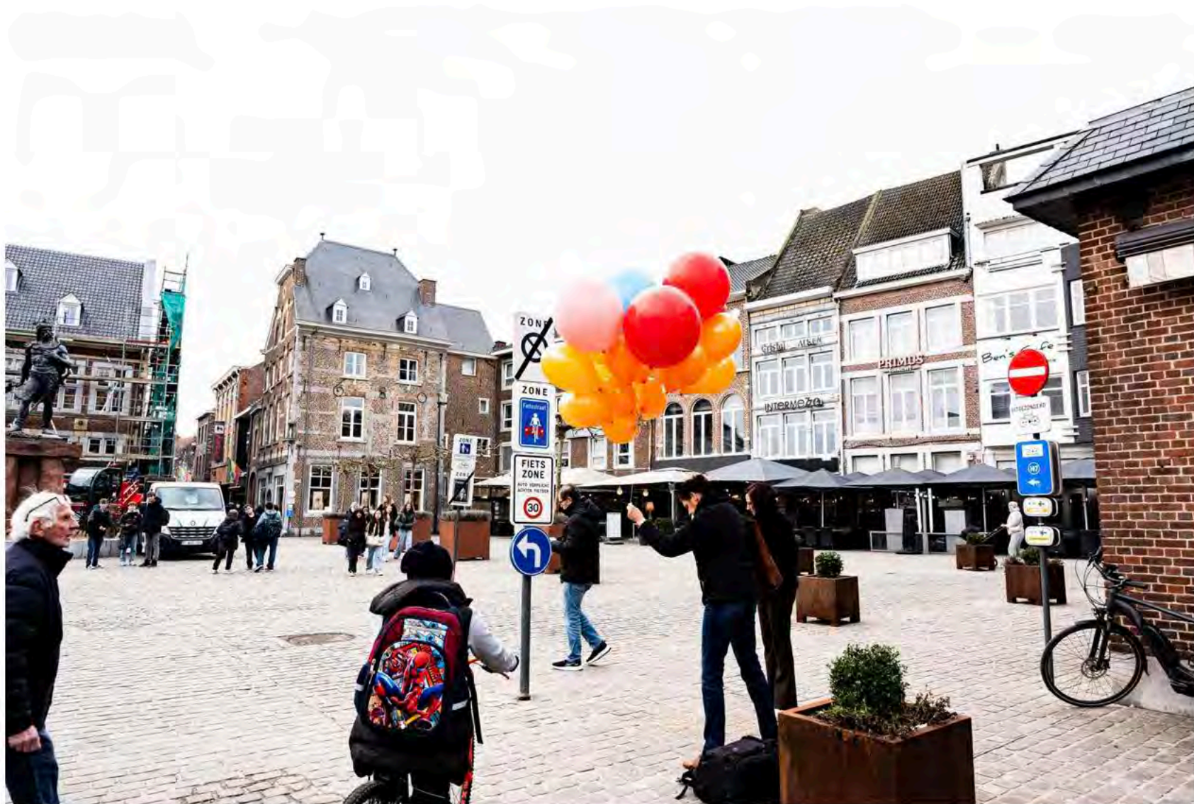
Aan het standbeeld van Ambiorix liet Burgers Eerst ballonnen op om te illustreren hoe hoog de molens worden.

In 2017 waren er plannen van Storm/Eneco voor de inplanting van zes windturbines van 180 meter hoog in Vreren. Dat lokte toen veel protest uit bij een groep omwonenden. Het vergunningsdossier werd uiteindelijk onvolledig verklaard. Goed zeven jaar later plannen Storm, Eneco en Eoly een windpark met vier turbines ten oosten van Vreren, met een tiphoogte van 200 meter en een masthoogte van 125 meter. In de omgeving (Juprelle) zijn al vijf turbines operationeel.