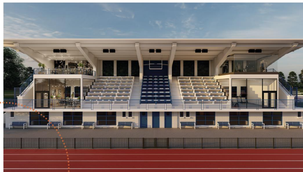
3D tekening van wat de tribune zou kunnen worden. Het huidige stadsbestuur zal de tribune afbreken en vervangen door een nietszeggend bruin legoblokje.

'Burgers Eerst' ging op onderzoek met 2 experts, die concludeerden dat het gebouw allesbehalve bouwvallig is en de betonrot vrij makkelijk te herstellen is. De tribune vormt in de ogen van 'Burgers Eerst' een visuele baken in het overwegend vlakke stadspark 'de Motten'. De tribune heeft als bühne ook diverse gebruiksmogelijkheden in petto. Op vraag van 'Burgers Eerst' maakte een ontwerper een 3D tekening van een mogelijke herbestemming van de tribune. De tekening laat ons toe om, wars van de tekenen van verval als gevolg van een gebrek aan onderhoud, de schoonheid van het gebouw te waarderen. Het gebouw slopen is voor ons, 'Burgers Eerst', dan ook uitgesloten.