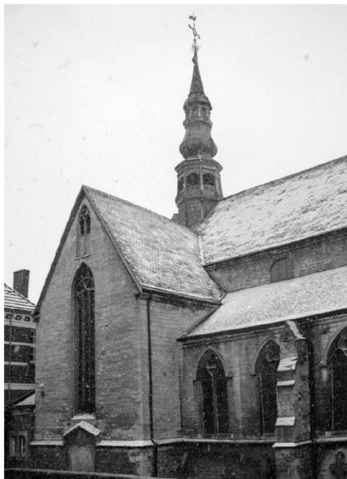
Hulpbehoevenden worden vergeten

Maar hoe gaat het stadsbestuur om met erfgoed waar ze wel een inbreng in heeft, zoals de ontwijde Begijnhofkerk , haar eigendom. Sedert de jaren 1980 zijn er architectuurplannen voor de restauratie van de kerk en nog steeds is er niets gebeurd met dit Unesco Werelderfgoed. Gedurende meer dan 35 jaar laat de Stad de kerk aan haar lot over en staat ze er verwaarloosd en gesloten bij.