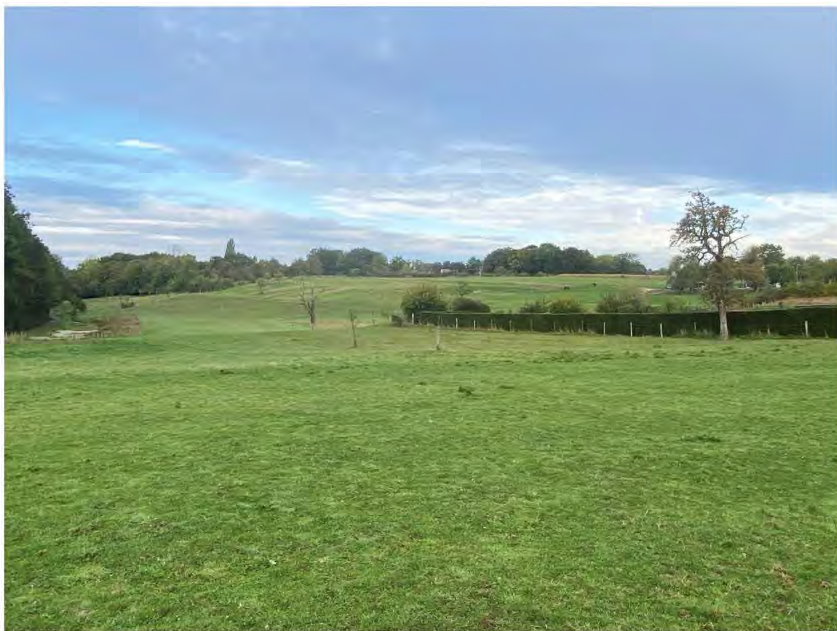
Over dit onaangetast stukje Haspengouw gaat het. Hier komt een kmo-zone van 5,5 hectare. Links ziet u nog net een stukje tracé van het Fruitspoor.